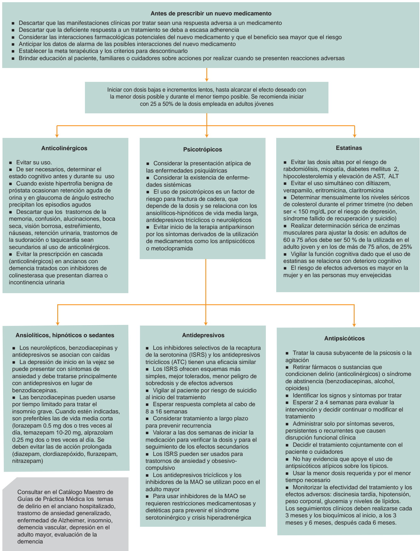
Algoritmo 2. Prescripción farmacológica razonada durante la atención del adulto mayor