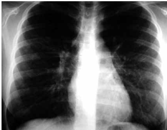
Figura 2 Radiografía de tórax que demuestra patrón bronquítico crónico con bronquiectasias hiliares y basales (EPOC)

En el mes de junio del año 2014 se realizó el congreso de la Academia Europea de Alergia e Inmunología Clínica, donde se presentó un cartel titulado: Anafilaxia drogoinducida en Latinoamérica, con la participación de médicos latinoamericanos, incluidos mexicanos, los cuales concluyen que el grupo farmacológico de mayor riesgo son los antiinflamatorios no esteroideos, seguidos de los antibióticos betalactámicos y no betalactámicos. Con una prevalencia de anafilaxia de 28.8 % (y de estos casos, 47 % con anafilaxia severa, reportándose choque asociado en el 28 % y recibiendo epinefrina 23 %), siendo los síntomas respiratorios y gastrointestinales los de mayor incidencia. 1