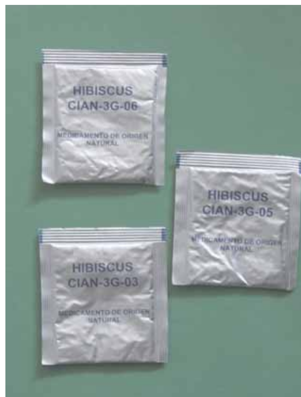
Figura 3 | Fitofármaco elaborado con el extracto de Hibiscus sabdariffa (CIAN-3G-03 que contiene 10 mg de antocianinas y CIAN-3G-06 que contiene 20 mg de antocianinas) y pravastatina (CIAN-3G-05, con 20 mg)

En la búsqueda de nuevas alternativas terapéuticas y con evidencia del uso de antioxidantes para disminuir la formación de placa aterosclerosa, en México se están realizando estudios con el extracto acuoso de los cálices secos de la especie vegetal Hibiscus sabdariffa (agua de jamaica) para el manejo de la hipercolesterolemia. Así, un estudio clínico exploró el efecto de una infusión de 10 g de cálices en 1 L de agua/día, administrada durante un año en pacientes con hipercolesterolemia; se observó que redujo 20 % los niveles séricos de colesterol y 18.9 % los triglicéridos, con incremento de los HDL. Los resultados obtenidos mostraron que el producto es efectivo para reducir los niveles de colesterol total y de triglicéridos, con incremento en las lipoproteínas de alta densidad. Los autores concluyen que la infusión podría ser utilizada como recurso natural alimentario coadyuvante en el tratamiento médico de la hiperlipidemia. 26