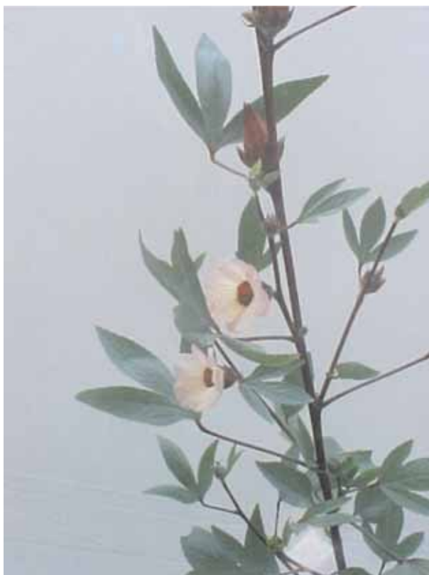
Figura 1 | Espécimen de vivero de la especie vegetal Hibiscus sabdariffa

cardiopatía isquemia, con una correlación muy estrecha con hipercolesterolemia ( r = 0.60 ), que junto con la diabetes mellitus mostró ser los factores de riesgo más relevantes, por arriba del tabaquismo y de la hipertensión arterial: Así, la hipercolesterolemia es un excelente predictor de mortalidad temprana y tardía por cardiopatía isquémica, con 9 % de incremento en el riesgo de morir por enfermedad cardiovascular por cada incremento de 10 % en los valores séricos de colesterol; los individuos con colesterol mayor a 240 mg/dL tienen ocho veces más posibilidades de desarrollar cardiopatía isquémica (RM = 8.1, IC 95 % = 3.8-17.1). 5 Como regla general se considera que existe hiperlipoproteinemia cuando el colesterol plasmático es > 5.2 mmol/L (200 mg/dL) o el nivel de triglicéridos supera 2.2 mmol/L (200 mg/dL). 6