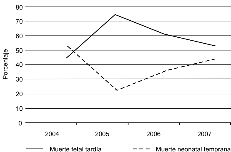
Figura 2. Relación entre el porcentaje de muerte fetal tardía y mortalidad neonatal temprana. Valor de p = 0.03