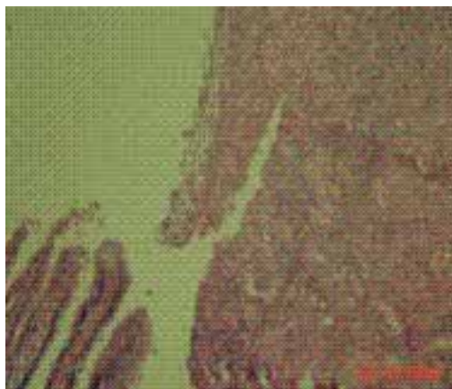
Figura 4. Mucosa gástrica con úlcera y fisura en punta de lápiz

Estenosis pilórica por enfermedad de Crohn