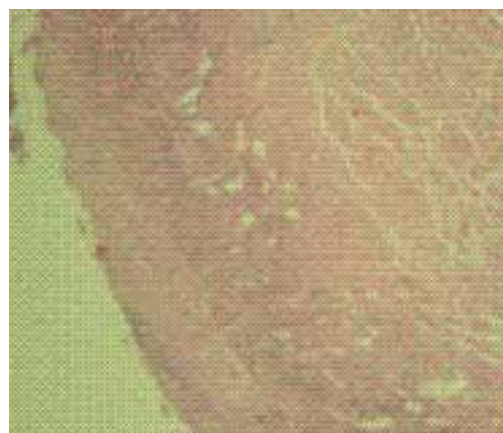
Figura 5. Úlcera en mucosa gástrica con tejido de granulación hasta la muscular propia