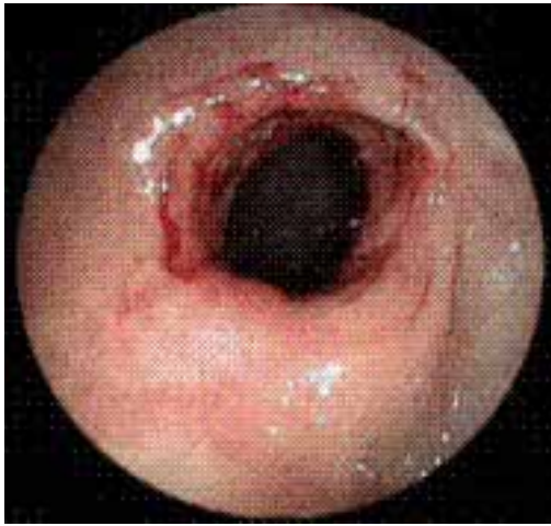
Figura 3. Se aprecia estenosis circunferencial de bordes regulares a 55 cm del margen anal a nivel del ángulo esplénico, que obstruye 70 % de la luz y no permite el paso del colonoscopia; mucosa macroscópicamente normal

sin datos concluyentes. El colon por enema no indicó alteraciones, con paso adecuado del material de contraste (figura 1). Por colonoscopia se observaron dos estenosis de colon: la primera a 50 cm del margen anal, con una estenosis circunferencial de bordes regulares que obstruía 30 % la luz, franqueable con el colonoscopia (figura 2); la segunda a 55 cm del margen anal, en el ángulo esplénico, circunferencial, de bordes regulares, mucosa macroscópicamente normal que obstruía 70 % de la luz y no permitía el paso del colonoscopia (figura 3).