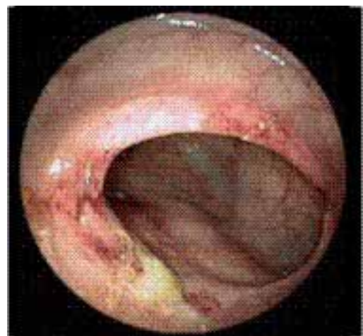
Figura 2. Se observa estenosis circunferencial de bordes regulares a 50 cm del margen anal, que obstruye 30 % la luz franqueable con el colonoscopia

de la inspiración, sin integrarse síndrome pleuropulmonar, ruidos cardíacos rítmicos de intensidad disminuida con soplo telemesosistólico II/IV en foco mitral, sin adenomegalias axilares, dolor a la palpación media en epigastrio y cuadrantes inferiores. Los estudios de laboratorio no indicaron anomalías. Se realizó ultrasonido abdominal que indicó hígado aumentado de tamaño, con dilatación moderada de la vena cava y vasos suprahepáticos, sin dilatación de la vía intra o extrahepática. Serie esofagogastroduodenal sin datos patológicos. La tomografía axial computarizada de abdomen mostró engrosamiento de la pared del íleon de aproximadamente 3 mm. Por panendoscopia se diagnosticó hernia hiatal tipo 1, gastroyeyunoanastomosis permeable y cambios anatómicos gástricos posquirúrgicos. La centellografía