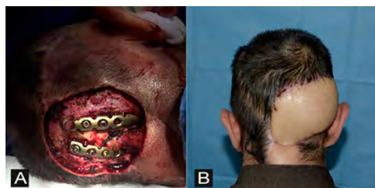
Figura 2 A) Defecto complejo a nivel occipital con exposición de material de osteosíntesis. B) Cobertura del defecto con un colgajo microquirúrgico anterolateral del muslo (ALT)