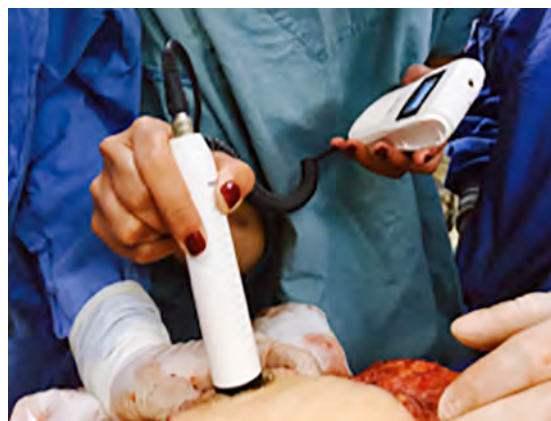
Figura 5 Dispositivo Doppler portátil

En la medida de lo posible, realizamos este tipo de procedimiento con dos equipos quirúrgicos simultáneos. El primer equipo (compuesto por el autor principal del estudio y dos residentes) levanta el colgajo, mientras que el segundo equipo (compuesto usualmente por dos residentes) realiza la disección de los