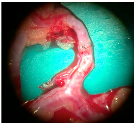
Figura 4 Anestomosis término-terminal con sutura continua en vasos de 0.7mm (magnificado 14x)

preferimos va de 8-0 a 12-0 (USP) dependiendo del diámetro de los vasos, siendo la sutura USP 10-0 con aguja ahusada, 3/8 y 5 mm la más utilizada por nuestro servicio (figura 3 C).