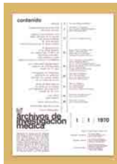
Figura 3 Fotografía de la portada del primer ejemplar de Archivos de Investigación Médica en 1970. Centro Médico Nacional.