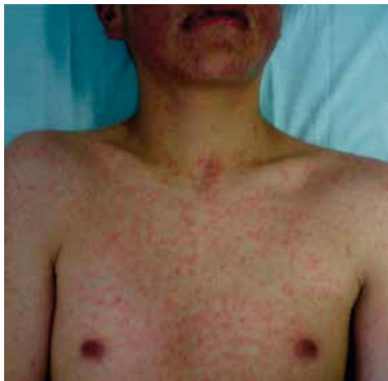
Figura 1 Afección de mucosa labial, máculas y pápulas eritematosas

De acuerdo con Singer y Wallace, 5 el síndrome de hipersensibilidad por alopurinol se establece por la historia inequívoca de exposición a la droga, ausencia de otros fármacos que causen un cuadro clínico similar, y manifestaciones clínicas que incluyan al menos uno de los siguientes criterios mayores: a) empeoramiento de la función renal, b) daño hepatocelular, c) erupción cutánea como necrólisis epidérmica tóxica, síndrome de Stevens-Johnson, eritema multiforme, exantema máculo-papular generalizado o dermatitis exfoliativa generalizada. A estas manifestaciones se le