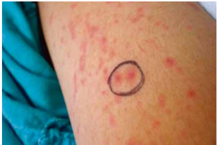
Figura 2 Pápulas dispuestas en forma de diana o de "tiro al blanco"

Aunque en México la prevalencia de reacciones adversas asociadas a alopurinol es incierta, parecen ser infrecuentes. En un estudio prospectivo a 10 meses con 4785 pacientes en un hospital público de la ciudad de México, la prevalencia de reacciones cutáneas adversas fue de 0.7 %. Los fármacos frecuentemente implicados fueron amoxicilina, anfotericina B y metamizol. 8 En otro estudio más reciente realizado por otra