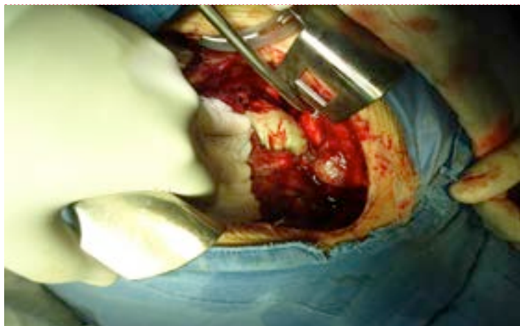
Figura 1 Se aprecia resección de la orejuela derecha del 70 %, con sustitución de esta con pericardio bovino

Se inició procedimiento bajo anestesia general balanceada, con abordaje por vía esternotomía media, pericardiectomía y referencia de pericardio, canulación bicaval con cánulas rectas, y aórtica sin complicaciones. Se decidió manejar cardioprotección con cardioplegia fría cristaloide intracelular a 30mL/kg, con pinzamiento aórtico en hipotermia de 28 °C.