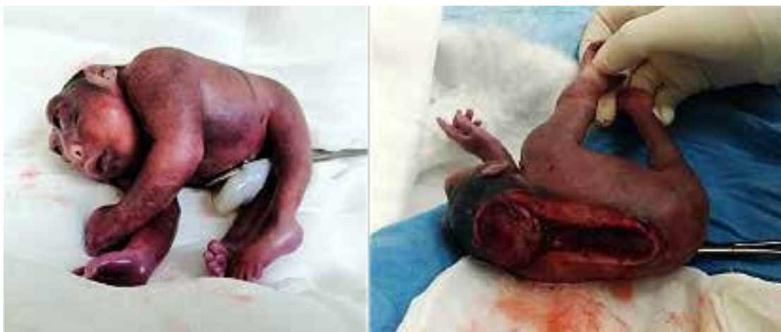
Figuras 1 y 2 Feto con craneorraquisquis de 25 semanas de gestación. En las imágenes se observa la presencia de anencefalia y espina bífida