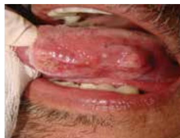
Figura 3 Lesión tumoral ulcerada infiltrada e indurada en borde lingual izquierdo correspondiente a carcinoma escamocelular