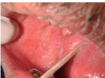
Figura 1 Placas blancas reticulares afectando mucosa vestibular derecha características de liquen plano bucal

De acuerdo con los criterios clínicos sugeridos recientemente para sustentar el diagnóstico de LP, las lesiones bucales deben ser imperiosamente bilaterales y simétricas, conformarse por líneas blanquecinas ligeramente elevadas y anastomosantes, formando un patrón en red. Estas características en patrón reticulado deben estar siempre presentes, incluso en los otros tipos morfológicos de LPB, para ser considerado como tal. 5 Sin embargo, estos criterios son inadecuados al no considerar los demás patrones clínicos del LPB, cuando las lesiones reticulares están ausentes; en consecuencia, pueden verse excluidos del diagnóstico de LPB algunas presentaciones clínicas, siendo verdaderos LPB. Además, los criterios clínicos para LPB se basan solo en el aspecto físico de las lesiones y, por tanto, pueden incluirse en el diagnóstico de LPB, otras lesiones con la misma imagen clínica, sin corresponder realmente a un LPB. Por otra parte, tampoco se toman en cuenta en estos criterios los agentes causales