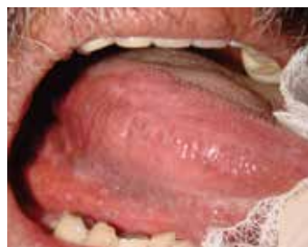
Figura 2 Placas blancas reticulares en vientre lingual y piso de boca del lado derecho compatibles con liquen plano bucal