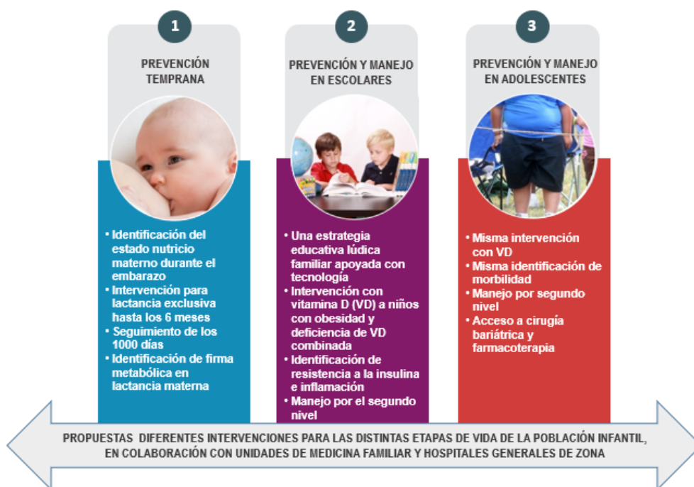
Figura 4 Red Transversal de Investigación de expertos en obesidad infantil

Para la Coordinación de Investigación en Salud, el trabajo de investigación organizado en Redes Transversales de Investigación colaborativa representa una de las principales estrategias para impulsar la medicina traslacional. Para ello la CIS cumple con funciones administrativas, regulatorias y de seguimiento, a fin de que todos los grupos obtengan resultados de alta calidad científica que beneficien a la salud de la población mexicana. Se otorgará a cada grupo el reconocimiento formal de su integración, a través de la