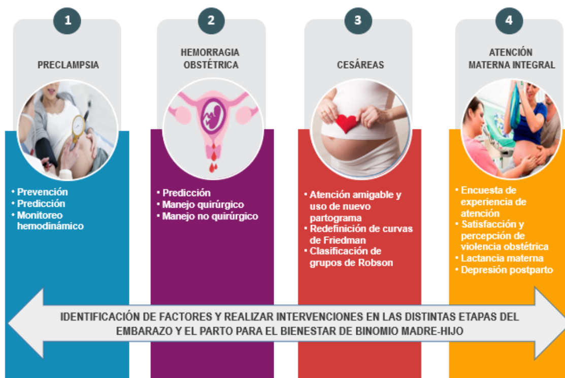
Figura 3 Red Transversal de Investigación en Embarazo