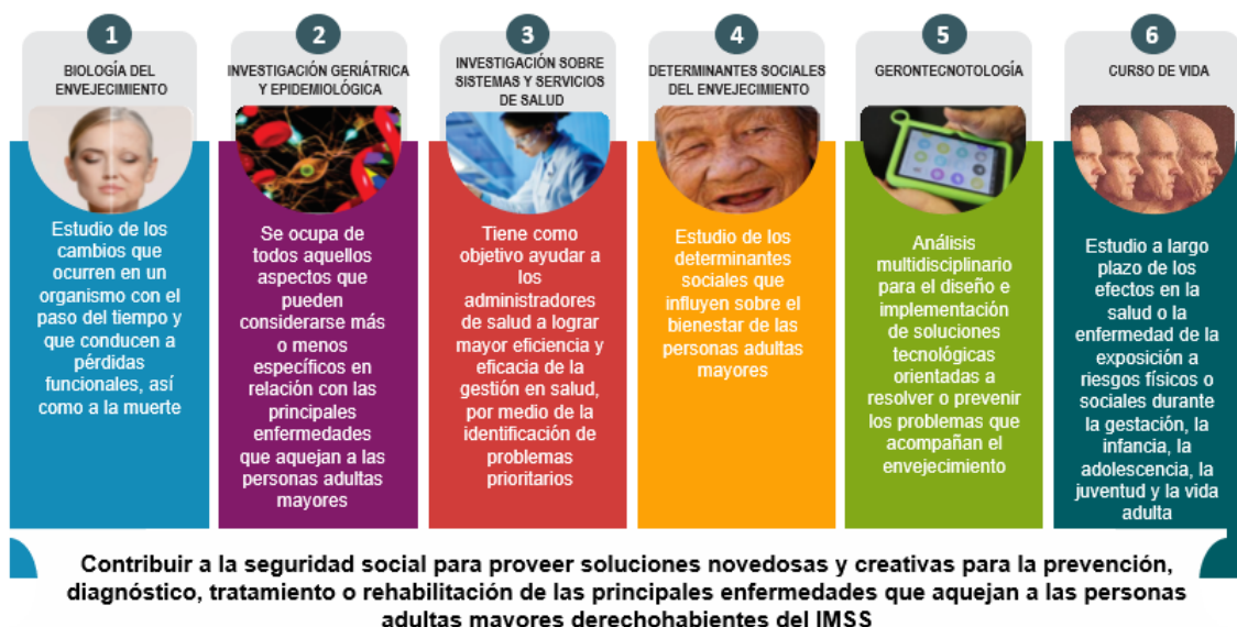
Figura 1 Red Transversal de Investigación en personas mayores y envejecimiento

Este grupo se enfoca en uno de los GSV de mayor impacto, que corresponde a los niños con patología onco-