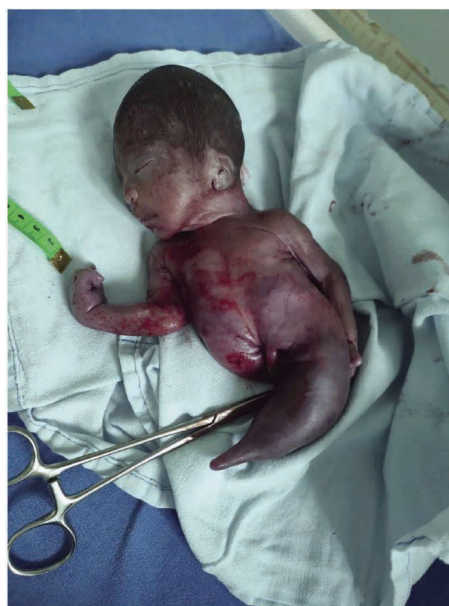
Figura 3 Recién nacido de 26 semanas con sirenomelia, es posible observar la fusión de las extremidades inferiores