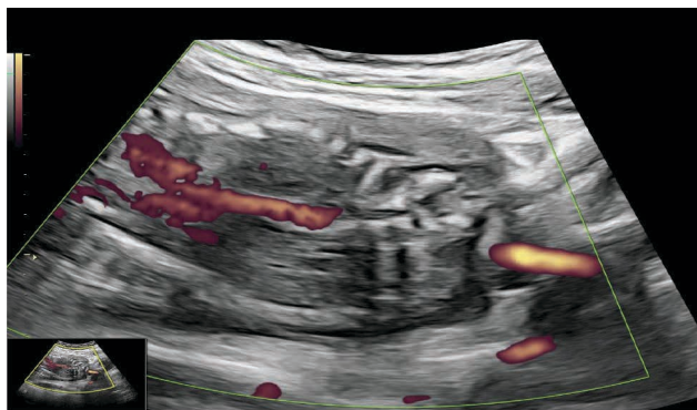
Figura 1 Corte coronal abdominopélvico donde no se logran observar las arterias renales a la aplicación de Power Doppler

La sirenomelia presenta habitualmente arteria umbilical única, la cual puede explicar la patogenésis del síndrome.