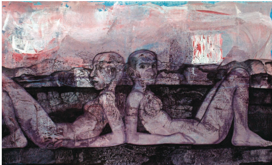
Figura 1 Mujeres Chac-Mool, acrílico/tela, col. Guillermo Ceniceros, 150 x 70 cm, 2005

lo tanto, deben ser fieles representaciones de la diversidad y complejidad de la vida. Esta obra es un claro ejemplo del pensamiento adelantado de Guillermo Ceniceros. Las temáticas de este gran muralista incluyen a la mujer (la figura humana) y a la naturaleza (el paisaje), las montañas escarpadas y los cuerpos en movimiento con formas simétricas. Su obra no es de denuncia, no tiene esa intención, pero sí de reflexión y misterio. Busca representar la figura humana sin emoción para develar a la belleza por sí misma. El Maestro Ceniceros se distingue por su capacidad de síntesis espacio-ideológica-temporal, por eso es capaz de tomar inspiración de nuestras culturas prehispánicas y reconfigurarlas a una eterna contemporaneidad.