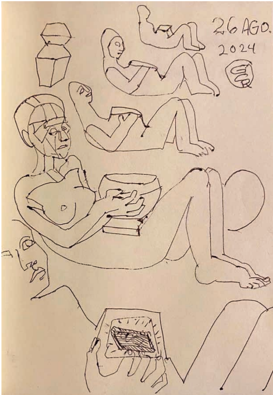
Anexo 1 Regalo del maestro Guillermo Ceniceros para la Revista Médica del IMSS: boceto de una mujer Chac-mol con el corazón en la mano