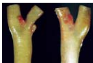
Figura 2 Corpúsculo carotídeo

del hombro, o anudarse la corbata con fuerza, lo cual origina presión sobre los barorreceptores carotídeos. Está asociado con hipertensión, cardiopatía isquémica, el género masculino y medicamentos como digoxina, alfametildopa y betabloqueadores. Es infrecuente en los jóvenes y se detecta hasta en un 10 % en la población anciana. 15