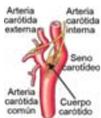
Figura 1 Seno y cuerpo carotídeo