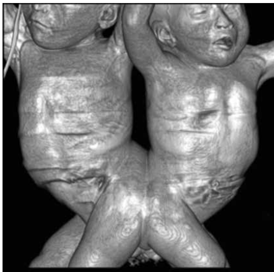
Figura 2 Imagen tomográfica que muestra las estructuras compartidas