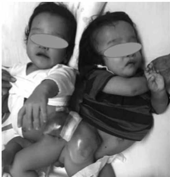
Figura 1 Gemelos unidos pigópagos

No se reportó ningún grado de circulación cruzada. El gemelo 1 era portador de cardiopatía congénita cianógena de tipo atresia pulmonar con comunicación interventricular, ductal dependiente, además de comunicación interauricular tipo ostium secundum y cabalgamiento de la aorta del 50%, arco aórtico a la izquierda. Requirió asistencia mecánica ventilatoria prolongada y manejo con prostaglandinas a dosis elevadas al nacimiento. Al momento del evento quirúrgico no requirió tratamiento médico. El gemelo 2 tenía como características microcefalia, retraso en el desarrollo psicomotor, hipoplasia cráneo-facial izquierda, paladar ojival y cuello corto. Fue operado de plastia de encefalocele roto a los cuatro días de vida. Se le prac-