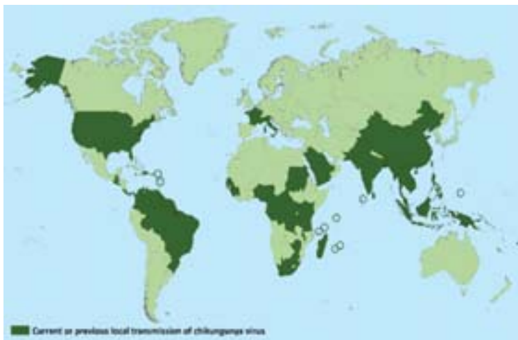
Figura 3 Países con casos de chikunguña (2014)

Cabe destacar que hasta el momento solo se han reportado en nuestro país seis casos importados o de ciudadanos extranjeros que han llegado al país durante el periodo de transmisibilidad y/o la fase clínica de la enfermedad. No se han documentado casos autóctonos, es decir, casos originarios de México en personas