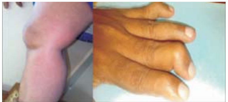
Figura 5 Manifestaciones articulares de CHIKV

Se pueden presentar casos atípicos (alrededor del 0.3 % de los casos) con manifestaciones clínicas específicas. 2,3,4,11