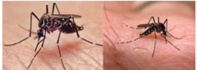
Figura 1 Aedes aegypti y Aedes albopictus

Desde 2005, la India, Indonesia, las Maldivas, Myanmar y Tailandia han notificado más de 1.9 millones de casos. En 2007 se notificó por vez primera la transmisión de la enfermedad en Europa, en un brote