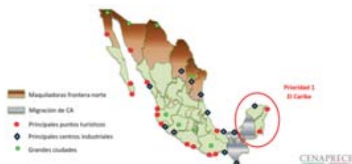
Figura 6 Se determina como prioridad 1 la península de Yucatán