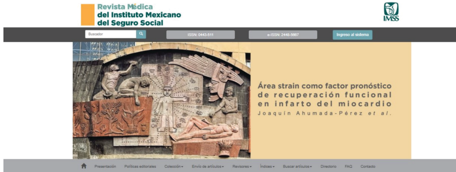
Figura 1 Portada del sitio de la Revista Médica del IMSS con la versión 2.4 del sistema de gestión editorial OJS (2017-2024)