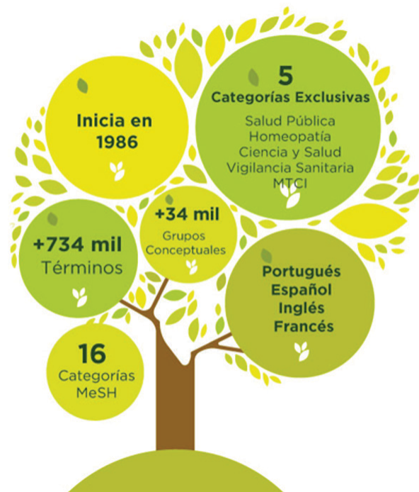
Figura 1 Las 5 categorías especiales del DeCS